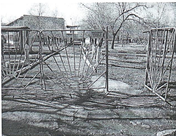
Фото № 1 Вход на территорию (калитка 1)