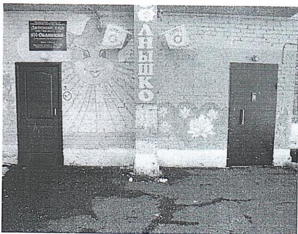
Фото № 3 Входная дверь в ДОУ